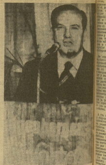
DUSELBERG. — El ministro de Información y Turismo, Alberto Martín Llaguno, en visita oficial a la República Federal de Alemania durante su estancia promovida en la Conferencia de Ginebra.

Monreal Luque, en Washington WASHINGTON 26. (Gfca). — El ministro español de Asuntos Exteriores, Alberto Martín Llaguno, llegará mañana a Washington para asistir a una reunión de ministros de los países de la Unión de Naciones Interamericanas (UNEA). El ministro, cuando se encuentre a nivel ministerial para estudiar la reforma del sistema económico internacional, también viajará a su capital el jueves y al martes. Monreal, que salió por la mañana de Madrid, via Nueva York, fue recibido en el aeropuerto internacional de Dulles