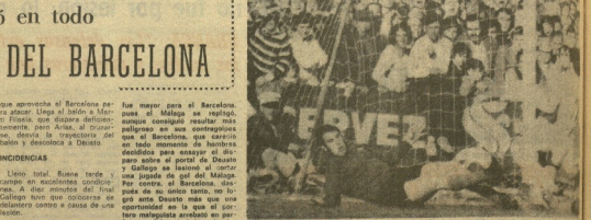
Primer gol del Málaga. Reina, en el suelo, nada pudo hacer.

Con el consiguiente juego al gol Claret, que se adelantó a Castellón.