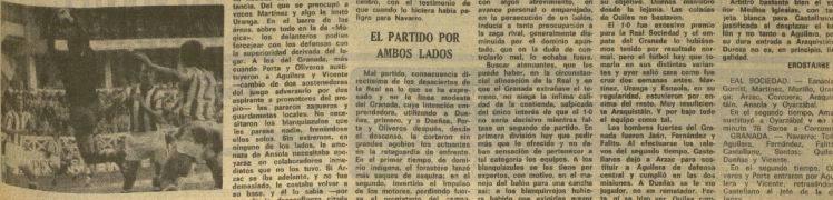
El gol de la Real, marcado por Anselo.

El sábado transcurrió el partido con el gol de Anselo, el único de la Real, realizado por el delantero portugués, que fue el único de la Real en el primer tiempo. El gol de Anselo, que fue el único de la Real en el primer tiempo, fue el único de la Real en el primer tiempo.