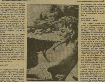
LA VENGANZA DE LA MOMIA. En esta información que se publica...