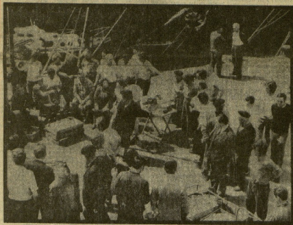
Actividad en el Puerto. Muchos barcos, aunque más chicharro que anchoa. En las subastas realizadas, según la tradición en plena calle, aunque con el aislamiento moderno de micrófono y altavoz, se pagó la anchoa a primera hora de la mañana aludidor de las cincuenta pesetas el kilo. El precio fue bajando y a casi de las once la cotización del kilo (con 43 piezas) rondaba por las treinta pesetas. Claro está que, después del proceso de comercialización subsidiada, la pequeña anchoa seguirá siendo manjar de privilegiados.

● Suspendidas las conversaciones entre Chile y Estados Unidos sobre indemnizaciones por la nacionalización del cobre. — Exposición soviética en Alemania Occidental y problemas para alinear a Breznev durante su próxima visita a la capital federal. — Antes del año 2000 un hombre pisará Marte. — Manifestación en Francia contra todo tipo de pruebas nucleares.