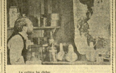
El crítico ha dicho:

"Excepcional película, dirigida por John Huston. Es de las películas que recomendamos a las públicas de edad avanzada, por su profundidad y su calidad técnica y artística en grado extremo." — MAYOR LIZABETH (UNIDAD).