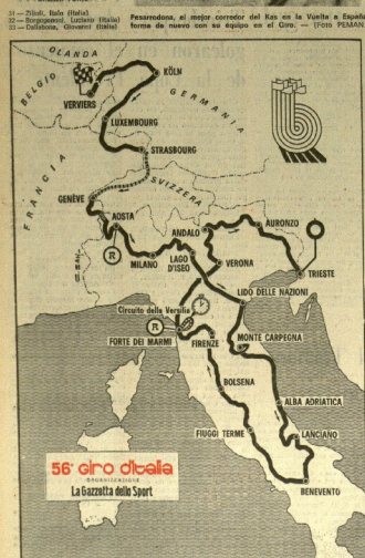
56º giro d'Italia ORGANIZZAZIONE La Gazzetta dello Sport

capaces de un escape que dura hasta París. El primer día de la carrera se iniciará el día 21 próximo en Vignola (Bélgica), y se prolongará hasta el día 28 en París. El primer día de la carrera se iniciará el día 21 próximo en Vignola (Bélgica), y se prolongará hasta el día 28 en París.