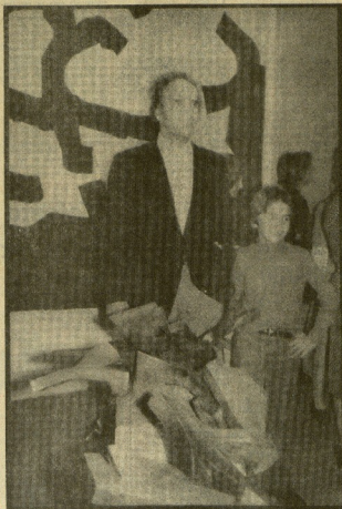
Chillida expone en Fagundes, con una obra importante donde aparece diversificada su fecunda personalidad. Es la primera vez que lo hace en la región, y ello es noticia de rango. En la foto, el escultor junto a una de sus creaciones.