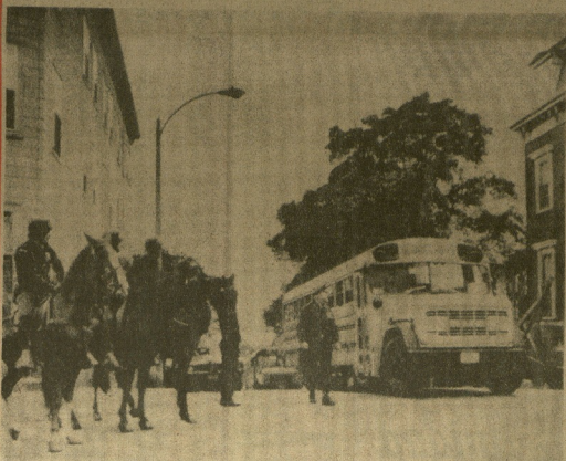
BOSTON. — Los disturbios raciales provocados por la decisión que se lleve a la práctica la integración en los escuelas, han obligado a que la policía proteja la llegada de los escolares negros a los centros de enseñanza. La fotografía está tomada en una escuela del sur de Boston el primer día de entrada en vigor de la nueva disposición.