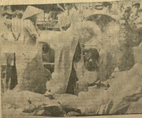
SAIGON. — Una mujer agacha la cabeza sobre las cadáveres de las víctimas de la explosión del avión de la Air Vietnam, a causa de dos granadas de mano. El piloto del avión se salvó, pero no pudo escapar y el avión que transportaba 71 pasajeros se quedó en el suelo.

En Honduras Se busca al asesino Del embajador de Formosa