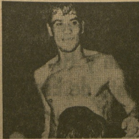
nos Foradada para felicitarle el número de su ciudad natal.