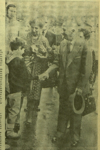
Durante el último oficial de Franco en 1963, inauguró una sala para el estudio de los problemas económicos... En 1968, Franco llega a San Sebastián... En 1968, Franco llega a San Sebastián y se reúne con el Consejo de Ministros...