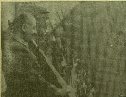
Franco, nombrado el hijo principal de la Diputación Foral, condecorado al entablado del pueblo navarro, con motivo de la visita de 1937.

Tres veces estuvo en nuestra tierra, la primera para imponer al escudo del viejo reino la Cruz Laureada de San Fernando