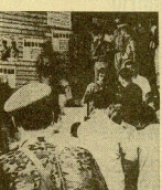
Una explosión en Amman, Jordania, causó cientos de heridos y muertos.

AMMAN (11 de Septiembre) — La situación en Jordania es dramática. Los palestinos que habitan en Amman, en las zonas de la ciudad de Amman, se encuentran en una situación de extrema tensión. Los palestinos que habitan en Amman, en las zonas de la ciudad de Amman, se encuentran en una situación de extrema tensión.