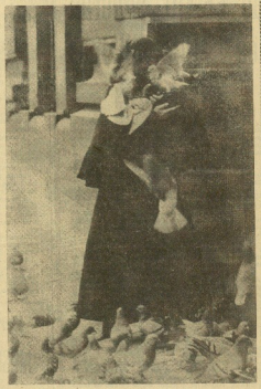
EN LA GUERRA

La columbiguerra es un curioso deporte nacido en España (sobremanera en el año 1934 se usó la Federación Española Columbiguerra), la primera del mundo, ya hace mucho tiempo, tenemos noticias de que se ha celebrado en el Puerto de Santa María (Cádiz), la final del Campeonato Nacional de Palomas Deportivas, con participación de casi medio centenar de representantes de todas las federaciones regionales y provinciales, con que cuenta este deporte. En Jaén regresa el vencedor, Copo de S. M. el Rey.