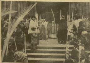
Comenzó la Semana Santa con los cofrades del Domingo de Ramos, y en todos los templos se actuó también con el traslado de fotos. Ofició en la catedral el obispo, don Esteban Aguirre, que presidió perfectamente la procesión en el altar.