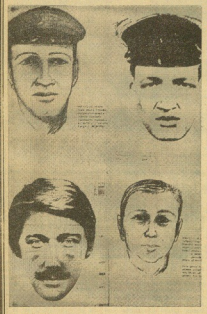
ROMA.—Foto-robot de los presuntos secuestradores facilitado por la policía.—(Foto UPI-Efe).

El establecimiento se encuentra próximo al lugar del secuestro