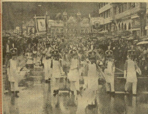
La tan agudada celebración dorostava que es la tamborrada infantil, y que se pudo ver ayer en su día, se llevó a efecto ayer. Hubo, al principio, sorpresa de Basauri que habiendo venido a dar el traslado con el fúnebre, pero no pasó y después y las compañías de chavales uniformados desfilaban por las calles entre el afecto y aplausos populares.