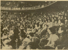
Miles de personas que habrán asistido a la convocatoria de la marcha de los parados, se congregaron en el Palacio de los Deportes de Madrid, donde los organizadores pronunciaron discursos.

MADRID, 20. (Esa). — Alrededor de 20.000 personas de todas las zonas de España se congregaron en el Palacio de los Deportes para la celebración de la marcha de los parados a la capital de España, según estimaron los organizadores. La presentación de la marcha se realizó en la concha del estadio, donde participó una gran multitud. En la presentación de la marcha se realizó en la concha del estadio, donde participó una gran multitud.