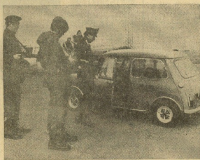
ROMA (Italia). — La policía italiana ha afirmado que todavía no tiene pistas sobre el paradero del presidente de la democracia cristiana, Aldo Moro, que fue secuestrado hace doce días. Las operaciones últimas se han centrado en las costas de la costa próxima a Roma y en las montañas de los Abruzzos.

Esta vez fue falsa alarma Otra amenaza de bomba a Lemóniz