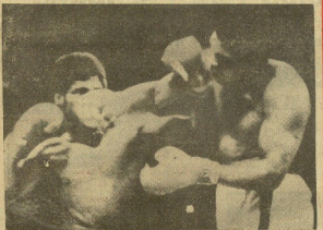
NOVELA GILLYAN. — Por tercera vez Cassius Clay se ha proclamado campeón del mundo de todos los pesos y aunque no pudo ponerlo a su adversario, ejemplar sobre Len Spinks nota superioridad, de lo que es un detalle la fotografía. — (LPI) (Sección). (Información en la página 16)