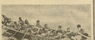
Los entrenadores de la casa de San Juan celebran el triunfo de su caballo en la séptima jornada del Gran Premio Nervián.

Se disputó ayer por la séptima jornada del Gran Premio Nervián, de trainerillas, que fue presenciado por un gran número de aficionados en ambas gradas y en las tribunas de Portugal y de San Juan. Se disputó en la pista de San Juan, con un público de unos 100 personas. El primer puesto lo ganó el caballo de la casa de San Juan, el segundo el de Portugal y el tercero el de San Juan.