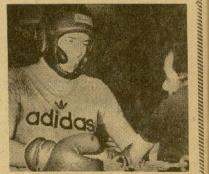
Alfredo Evangelista, campeón europeo de boxeo.