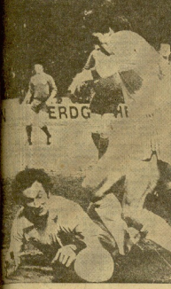
... y la meca de los deportes...