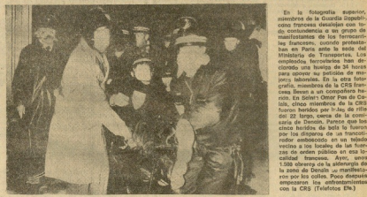
En la fotografía superior, miembros de la Guardia Republicana francesa desfilan con todo el contenido de un grupo de manifestantes de los ferrocarriles franceses, cuando protestaban en París ante la sede del Ministerio de Transportes. Los empleados ferroviarios han declarado una huelga de 24 horas para apoyar su petición de mejores salarios. En la otra fotografía, miembros de la CRS francesa llevan a un comunitario herido, en Solier-Clermont de Cahul, cinco miembros de la CRS fueron heridos por las de rifle del 22, cerca de la comisaría de Denain. Parece que los cinco heridos de bala fueron por los disparos de un francotirador emboscado en un tejado vecino a los locales de sal de la zona de Denain su manifestación por sus calles. Poco después empezaron los enfrentamientos con la CRS (Televisión Efe).