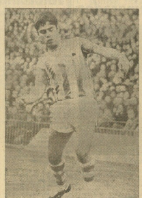
El jugador del Real Madrid...