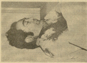
El cadáver del jefe de la Policía Municipal de Beasain.

EL HECHO OCURRIÓ A LAS NUEVE Y CUARTO DE ESTA MAÑANA