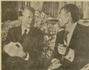
Los presidentes de Estados Unidos, Jimmy Carter, y de Egipto, Anwar Sadat, conversan en el palacio Yafar, de El Cairo. — (Teléfono EFE). — (información página 3.)

Hoy comienzan en Alejandria las conversaciones egipcio-norteamericanas pro paz en Oriente Medio