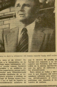
Kubala no dará la alineación del equipo español hasta esta noche.

El partido será transmitido por televisión en directo por el canal de televisión de Checoslovaquia. El partido será transmitido por televisión en directo por el canal de televisión de Checoslovaquia. El partido será transmitido por televisión en directo por el canal de televisión de Checoslovaquia. El partido será transmitido por televisión en directo por el canal de televisión de Checoslovaquia. El partido será transmitido por televisión en directo por el canal de televisión de Checoslovaquia.