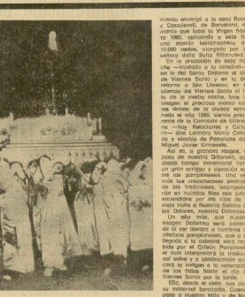
En la foto, el traslado de la difunta en la noche del día 2 de abril, cuando se encontraba en la cafetería Ibañeco de Pamplona, en la zona de los alrededores de la estación de ferrocarril.

AVANCE - 1.30 y 10.05. CAPELA MÉRIDA - 1.30 y 10.05. CAPELA PINCE - 1.30 y 10.05. CAPELA AMBITA - 1.30 y 10.05. CAPELA OULTI - 1.30 y 10.05. CAPELA GUBENZO - 1.30 y 10.05. CAPELA WAZEL - 1.30 y 10.05. CAPELA