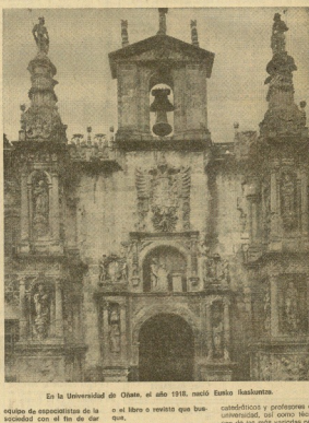
En la Universidad de Oñate, el año 1918, nació Eusko Ikaskuntza.

«Especialmente, respecto sobre todo largo tiempo, pero para poder conseguirlo, se trata de identificar en primer lugar todos los archivos existentes, dando a cada uno un lugar pertenencia. Para ello se va a enviar, tanto a las bibliotecas de la región, como a particulares y personas físicas o jurídicas, una circular con el fin de que remitan información de los libros que se han publicado en el País Vasco desde 1965.