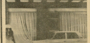
la fachada de la cafetería «Mistak» de la calle Irujoa. Vidriera, cuyo propietario resultó muerto al ser alcanzado en la cabeza por una bomba colocada en los servicios. El artefacto hizo explosión muy en el interior del local, y como se aprecia en la foto, la entrada del establecimiento apenas el resaca. — (Información en página 7)