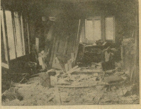
Un aspecto de la sala en la que hizo explosión el artefacto. (Información en página 16)