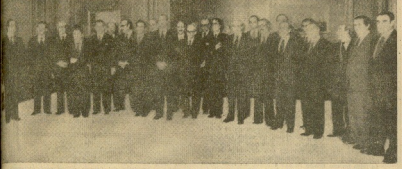
MADRID. — S. M. el Rey don Juan Carlos ha presidido en el palacio de la Zarzuela, el acto de juramento del primer Gobierno constitucional. La foto muestra al nuevo Gobierno, después del acto, posando para los fotógrafos, con don Juan Carlos.