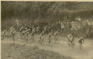
Concurranza de espectadores infantiles agudados a los ciclistas.