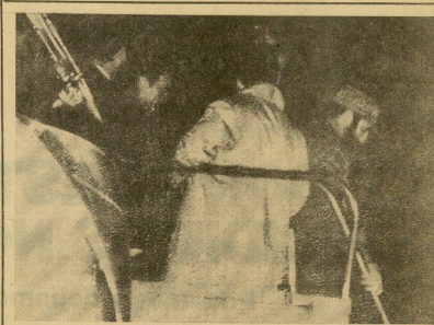
Esta tarde interviene ante la Asamblea General de la ONU CASTRO, EN LA PALATA

también argumentó que los procedimientos franceses se hicieron cargo de los diamantes de Bokassa, como se ha informado a los diputados como el Partido Socialista Unificado (PSU), pidiendo a Giscard que se constituya una comisión de encuesta.