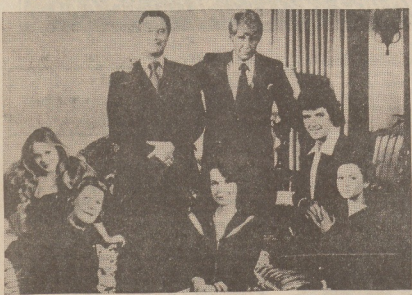
Las series norteamericanas, que inundan las televisiones de todo el mundo, han logrado levantar el interés de los teleespectadores.

Las encuestas señalan que cada vez gusta menos