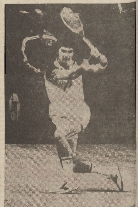
Connors, uno de los grandes favoritos para ganar el Masters, fue derrotado ayer por el sueco, y también favorito, Borg.

NUEVA YORK. (Efe.) — El norteamericano Vitas Gerulaitis, derrotado ayer, en un gran partido por el argentino Guillermo Vilas en el Gran Premio de Maestros, obtuvo su primer triunfo frente a su compatriota Harold Solomon, 6-1 y 7-6.