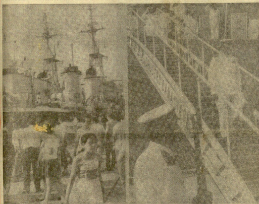
ALMERIA. E. — A la izquierda, la gente pasa por el puerto observando los buques de guerra, anclados en el muelle. A la derecha, el ministro de Marina, almirante Baltasar Calabro, levanta el crucero "El Cantar" para prevenir los actos de la Semana Naval, simulando vendibles los buques de guerra.