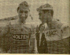
Ocaña y Merckx conversaron antes de tomar la salida de Saint-Etienne.