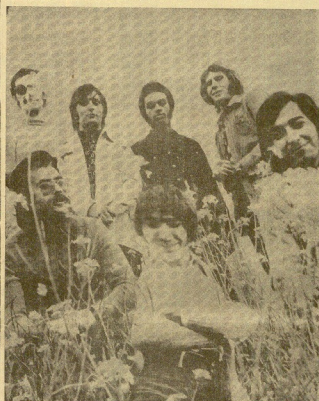
Del 13 al 18 de este mes actuación en boite "RU" de Ispalda del famoso conjunto internacional LOS GUARDIAN, adelantando su salida, porque en realidad ocurre la gira de darts.