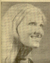
Constituyen los extraordinarios fallos en KE de la "caper-paga" de lana KETTY, que cada día que actúa gustan aún más, sus actuaciones.

TODOS LOS DIAS, TARDE Y NOCHE DISCOTHEQUE