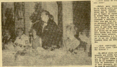
El ministro de Industria y Turismo señor Sánchez Bella, que presidió la última jornada del festival cinematográfico. (Foto BASTREITCHE).

En este momento, María Mahor se prepara para un recital de temas que fueron famosos en los años 40. El recital será presentado en un teatro de la ciudad, en el teatro de la ciudad, en el teatro de la ciudad.