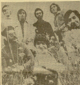
Estos chicos en la "boite" KU de Guipúzcoa para pedir por a LOS CANARIOS, que mañana se despedirán y a los cuales les he visto recibir mejor que la primera vez. Invitados, pues, a los desahucios empresarios de esta sala por las actuaciones de primera mano que ofrecen sin reparar en los gastos que supone el tener dichas actuaciones.

MAÑANA DESPEDIDA DE "LOS CANARIOS" EN KU