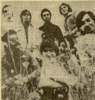
Resalta en esta comparsa en la "boite" KU, de Igeldo, la asociación internacional LOS CANARIOS. Durante la actuación los chicos fueron abrotados diacos y el día de la despedida se quedó en mitad de la gente fuera.