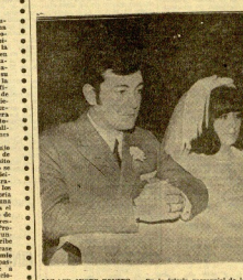
ENLACE JESU-BENTO. En la iglesia parroquial de los padres francescanos...