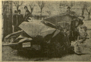
MADRID. — Muchos accidentes en las carreteras españolas, con un triste balance de víctimas, refleja este fin de semana, y sobre lo que es indolentemente expresivo el estado en que quedó este vehículo en la autopista de Burdeos. (INFORMACION EN CUARTA PAGINA.)