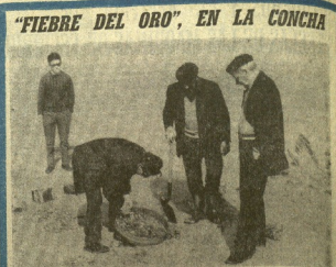
"FIEBRE DEL ORO", EN LA CONCHA. Los hombres que se ven en esta foto pasaron su infancia por entre las minas de la época dorada de California, en el "fiambre del oro" en Yukon, al tiempo de los mineros alborotados que levantaron una zona de autogobierno en la Concha, estos hombres, al por que desearon la curiosidad de los pasantes, para ser vistos, tomaron la memoria como un pañuelo estampo arrojado a un a cresta de estrocas.

—¿Cómo se comunica con la ciudadanía? —Se comunica con la ciudadanía mediante el servicio al ciudadano.