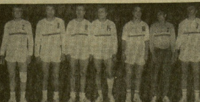
Lista inicial de Bulgaria.