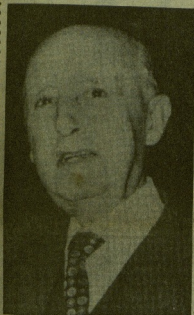
Francisco ha dado una lección más del patriotismo y de la serenidad que es consustancial a su alma. Y su rebeldía y generoso sacrificio da que todo quedará atrás y han estado garantizando el futuro de los españoles, se venga de modo progresivo e incesante.