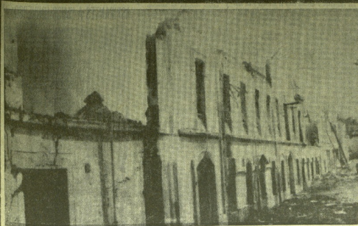
Pudo ser una tragedia en San Feliú de Guixols

Le ofrece sus últimas novedades para este verano