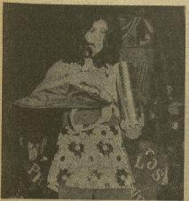
"SELVA", la joven Baletista doctorista que actúa en la semifinal del domingo.