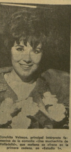
Cocula Velasco, principal intérprete femenino de la comedia...