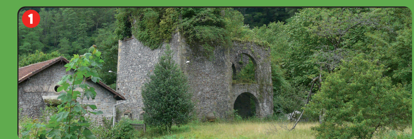
Hernaniko ainguren errege fabrika Real fábrica de anclas de Hernani Usine royale d'ancres d'Hernani