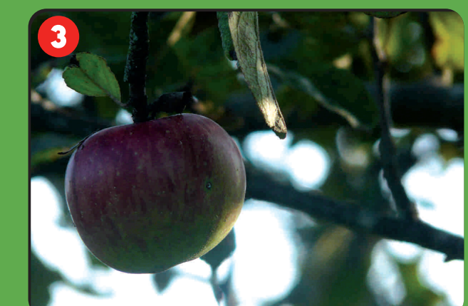
Sagardotegi inguruak Zona de sidrerías