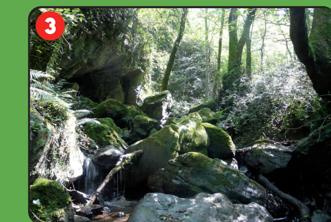
3 Landarbaso erreka ingururak Ribera de río Landarbaso Berges de la rivière Landarbaso