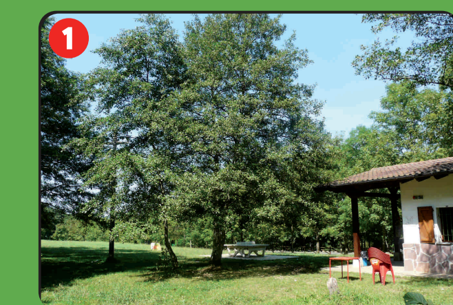
1 Listerretako atsedenlekua Área recreativa de Listorreta Aire récréative de Listorreta