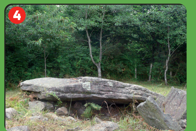
4 Igoingo lepu I trikuharria Dolmen de Igoingo lepu I Dolmen d'Igoingo lepu I